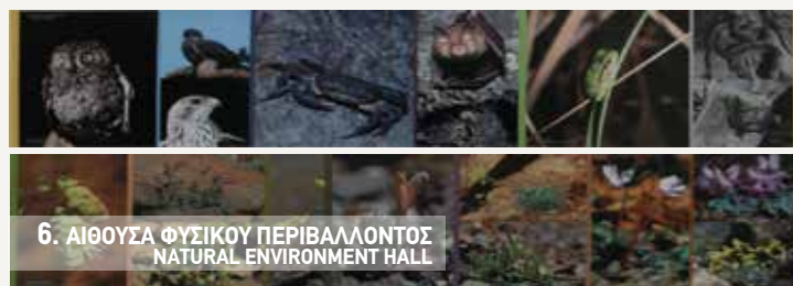
6. ΑΙΘΟΥΣΑ ΦΥΣΙΚΟΥ ΠΕΡΙΒΑΛΛΟΝΤΟΣ NATURAL ENVIRONMENT HALL