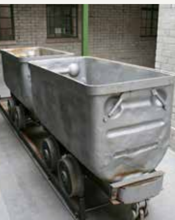
ΑΝΑΠΑΡΑΣΤΑΣΗ ΓΑΛΛΑΡΙΑΣ REPRESENTATION OF GALLERY