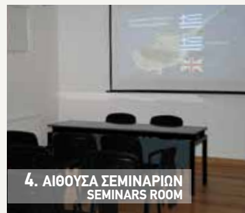
4. ΑΙΘΟΥΣΑ ΣΕΜΙΝΑΡΙΩΝ SEMINARS ROOM