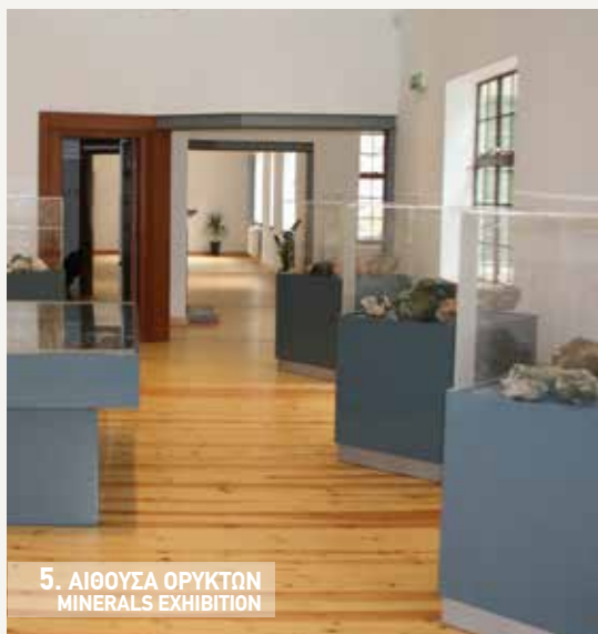
5. ΑΙΘΟΥΣΑ ΟΡΥΚΤΩΝ MINERALS EXHIBITION

The Troodos Geopark (an area of 1.147 km 2 ) Visitor Centre is located in the old Asbestos mine (Amiantos mine), an area with enormous historical value which now hosts an extraordinary botanical garden with information about the flora of the area, a seed bank of endemic species and also a plethora of evidence for the past mining activity and the community which once flourished there.