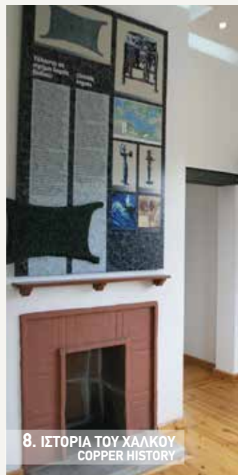
8. ΙΣΤΟΡΙΑ ΤΟΥ ΧΑΛΚΟΥ COPPER HISTORY