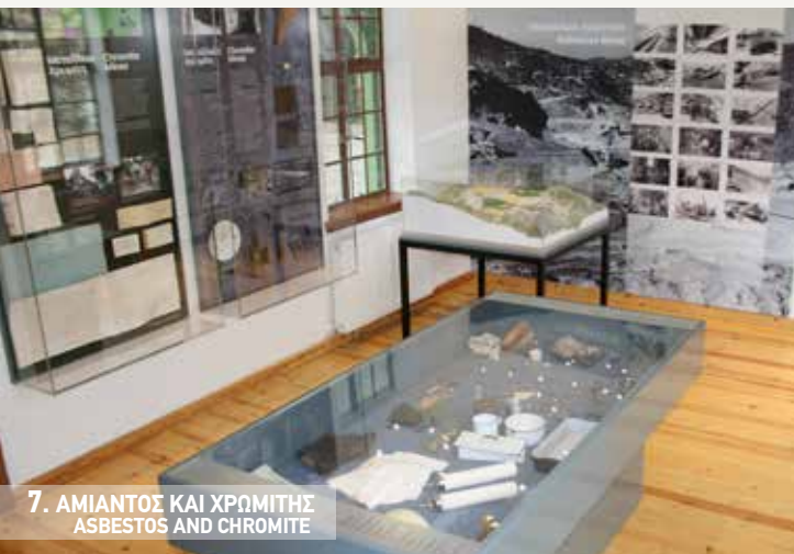
7. ΑΜΙΑΝΤΟΣ ΚΑΙ ΧΡΩΜΙΤΗΣ ASBESTOS AND CHROMITE