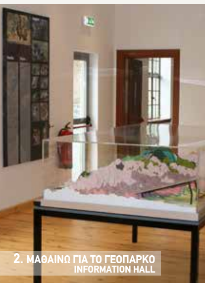
2. ΜΑΘΑΙΝΩ ΓΙΑ ΤΟ ΓΕΟΠΑΡΚΟ INFORMATION HALL