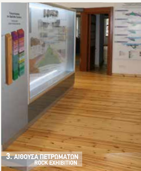
3. ΑΙΘΟΥΣΑ ΠΕΤΡΩΜΑΤΩΝ ROCK EXHIBITION